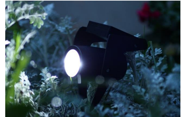
Ex. : Spot de balisage très efficace, 30 lumens