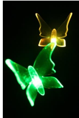
Ex. : Décoration solaire lumineuse avec tige flexible pour donner un effet poétique avec le vent