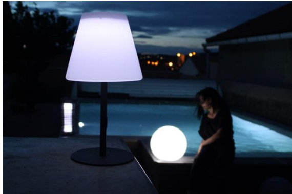
Ex. : Lampe design avec panneau solaire intégré – non visible